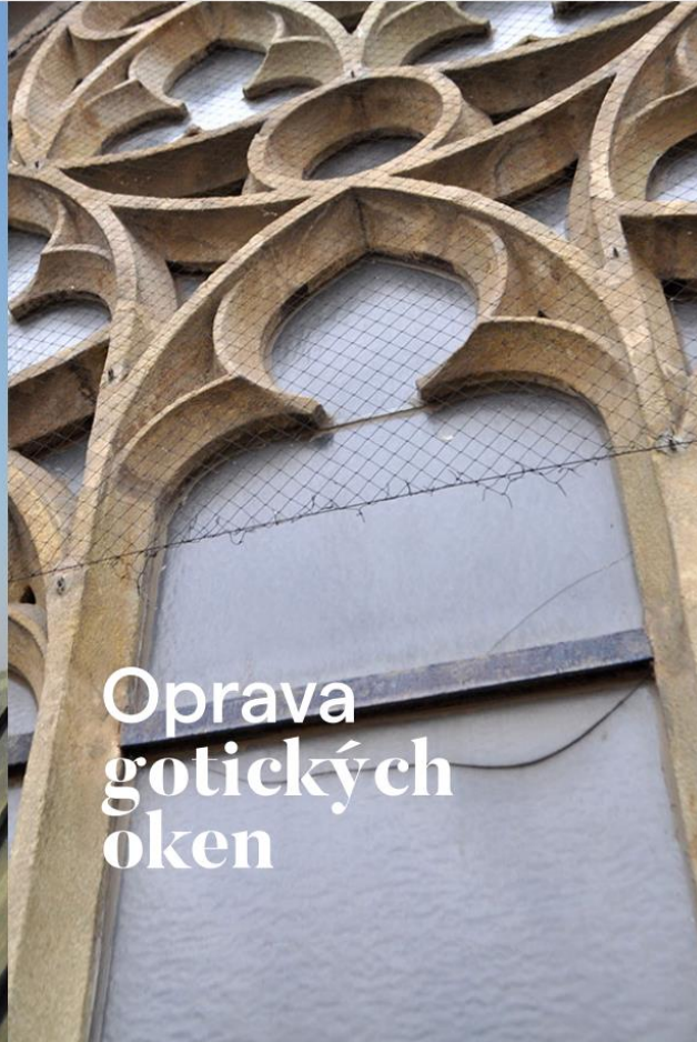
Oprava gotických oken