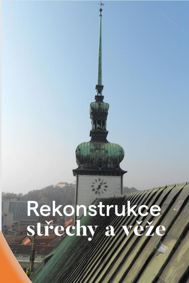
Rekonstrukce střechy a věže