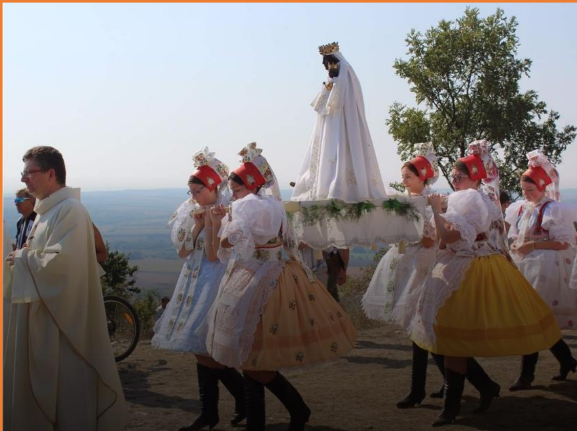
Aktivita „Pozvi Marii“