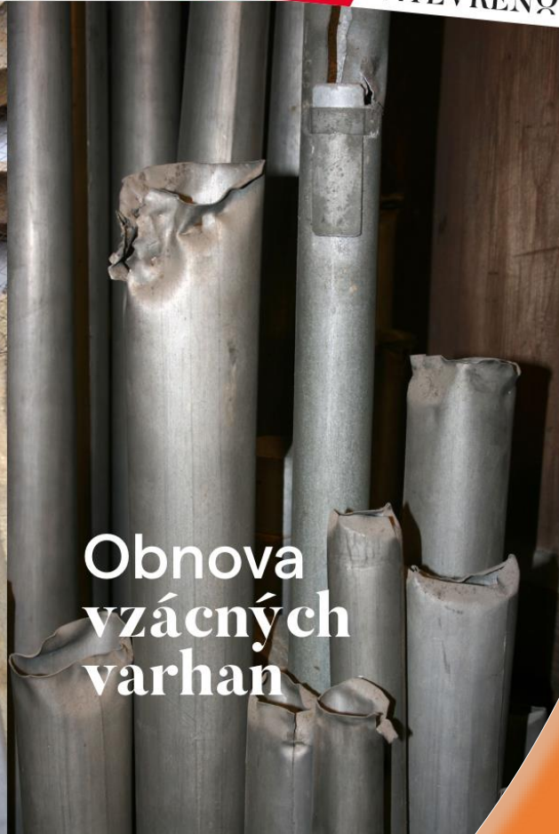
Obnova vzácných varhan