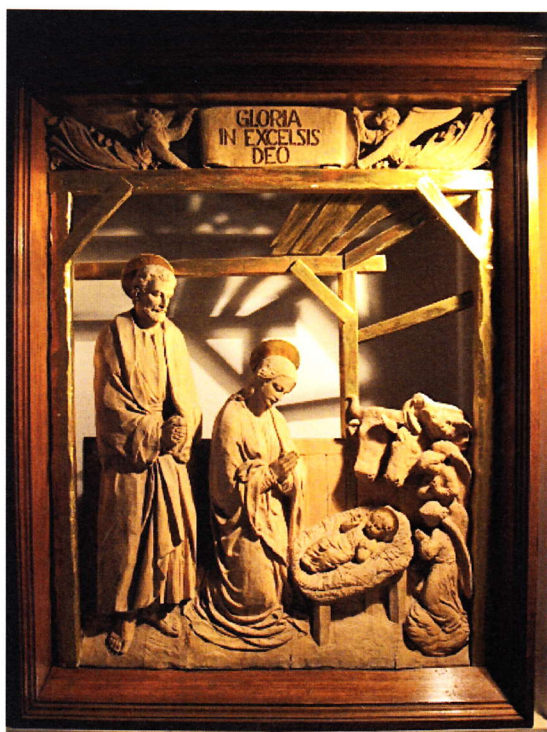
Původní oltářní obraz v kostele Svaté Rodiny v Brně