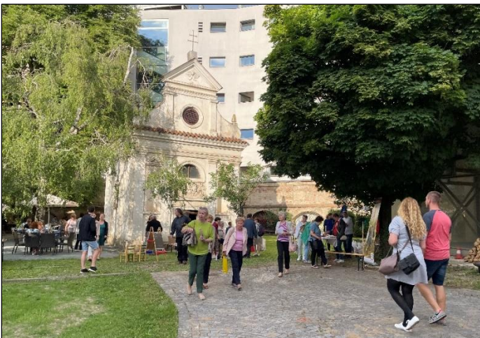
areál bývalého kláštera Voršilek, vchod z Josefské ul.