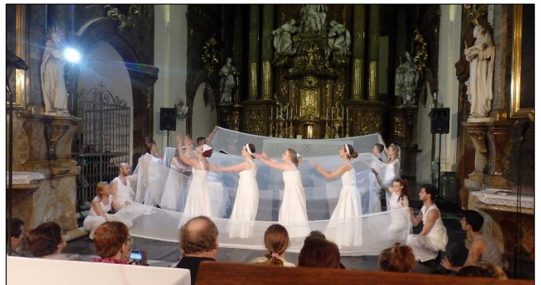
taneční divadlo MIMI FORTUNAE v kostele sv. Michala