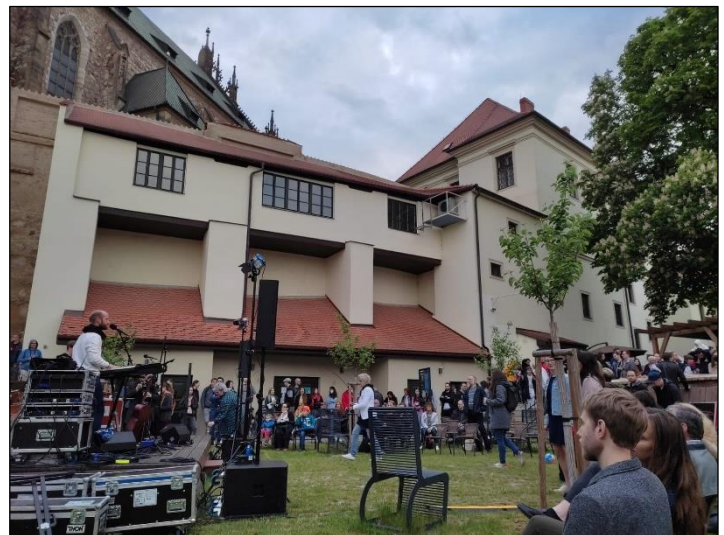
hudba v Zahradách pod Petrovem