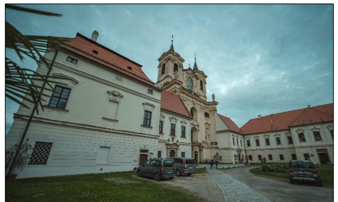
areál rajhradského kláštera