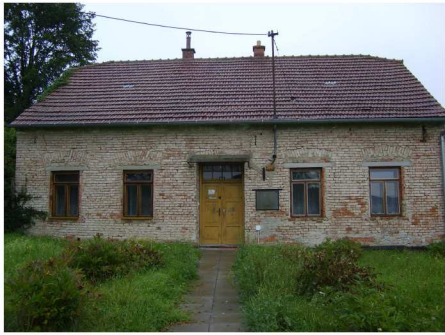
Fara v Nemotičích